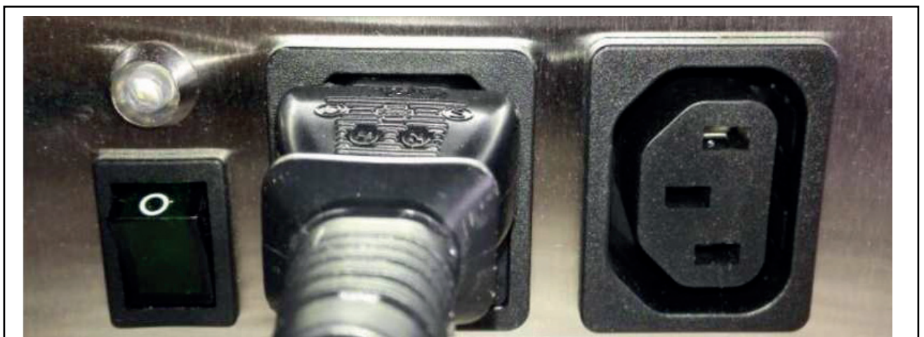
Abb. 2: Netzanschluss